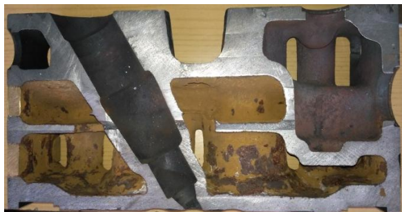
Рис. 1. Переріз головки циліндрів дизеля Д49

Проблематику появи тріщин на вогневному донці головки було описано раніше у [1]. Головки дизеля (рис. 1), що встановлюють на двигуни, відпрацьовують, у кращому випадку, лише 25% від необхідного терміну експлуатації. З цієї причини споживач постійно зацікавлений як в постачанні нових виробів, так і, що особливо актуально, в підвищенні терміну їх експлуатації.