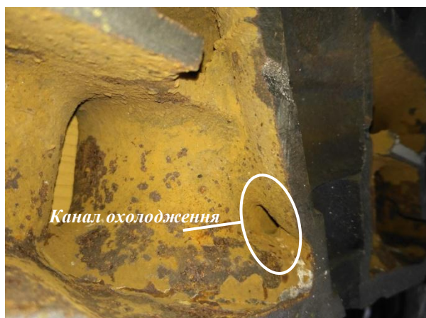
Рис. 3. Зона форсунки головки циліндрів дизеля Д49 з боку

Виклад основного матеріалу Основним чинником погіршення теплонапруженого стану та зменшення ресурсу вогневого донця головки циліндру є відсутність достатнього охолодження у зоні форсунки (рис. 3) та нерівномірне тепловідведення в охолоджуючу рідину, що обумовлене особливостями виготовлення деталі.