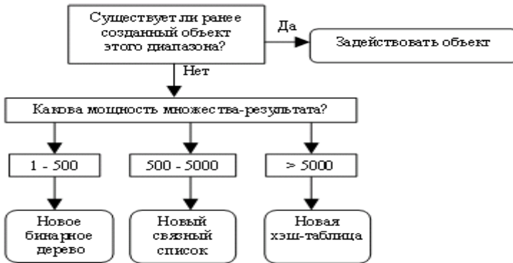
Рис. 2. Алгоритм выбора оптимального объекта-списка

4. Исходя из подсчитанной оценки размера результирующего множества пул ищет подходящий объект-список, используя алгоритм, представленный на рис 2: