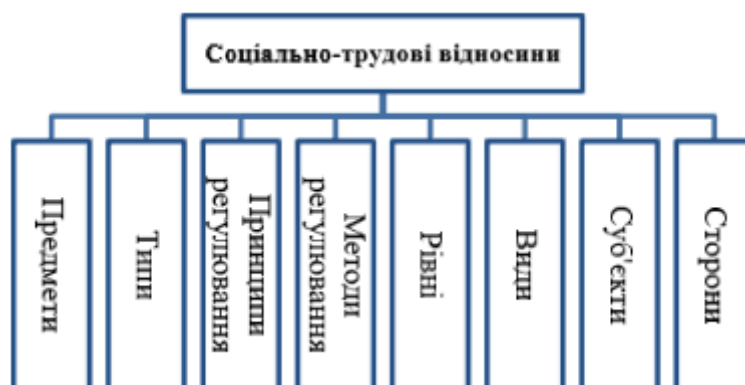
Рисунок 1 – Структура системи соціально-трудових відносин

Сукупність взаємопов'язаних елементів (параметрів) у широкому розумінні є системою. Кожен елемент системи має властиві лише йому якості; елементи пов'язані між собою і чинять вплив один на одного. Окрім цього, система не може існувати поза часом і простором. Структуру системи соціально-трудових відносин наочно зображено на рис.1. [2].