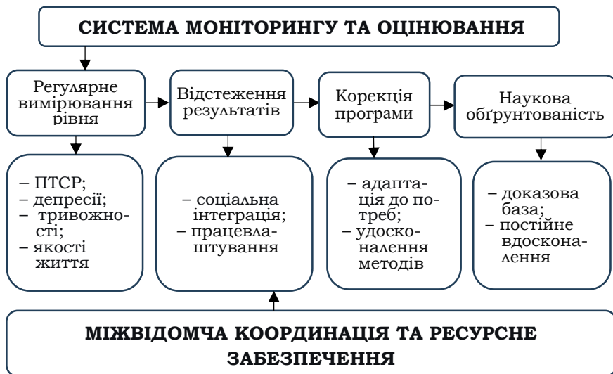
Рис. 2. Система моніторингу та оцінювання

Завершальним елементом є система моніторингу й оцінювання ефективності програми (рис. 2), яка передбачає регулярне вимірювання рівня ПТСР, депресії, тривожності, показників соціальної інтеграції, працевлаштування та якості життя ветеранів. Отримані дані забезпечуватимуть верифікацію результатів і дозволять своєчасно коригувати програму.