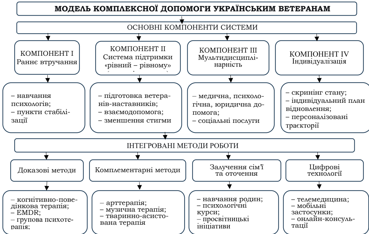
Рис. 1. Модель комплексної допомоги українським військовим ветеранам