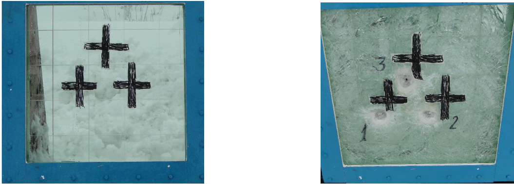
Рис. 2. Общий вид образца прозрачной брони на основе сапфира размером 500x500x56мм до (слева) и после (справа) пулевых испытаний, проведенных сотрудниками ГП «ХКБМ» согласно требований ДСТУ 4546:2006

Следует отметить, что поскольку данная конструкция еще не оптимизирована по необходимой прозрачности окна после обстрела, а также не имеет достаточного запаса прочности для защиты от пули калибром 12,7 мм, что также является актуальной задачей, необходимы дальнейшие исследования в этом направлении.