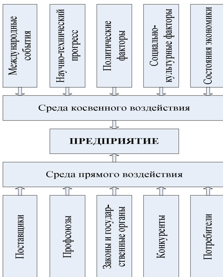
Рис. 1. Факторы внешней среды

В среде прямого воздействия уделяют особое внимание конкурентам. Это важный фактор, поскольку в настоящее время конкурентная борьба во всех экономических сферах продолжает обостряться. Проведение конкурентного анализа, оценивание конкурентоспособности предприятия и ее продукции на рынке актуальны.