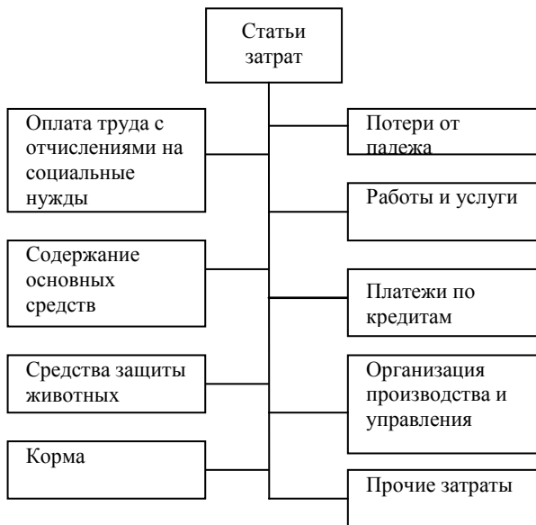
Рис. 1. Статьи затрат в животноводстве

В дебет счета 20.2 «Животноводство» в течение года списывают фактические затраты на производство, а на кредит – выход продукции в оценке по плановой себестоимости. В конце года после исчисления фактической себестоимости на корреспондирующих операционных счетах в дебет счета 20.2 относят также отклонения по корреспондирующим счетам, а на кредит счета 20.2 – отклонения фактической себестоимости животноводческой продукции от плановой. В результате полученная продукция оказывается оцененной на уровне фактической себестоимости.