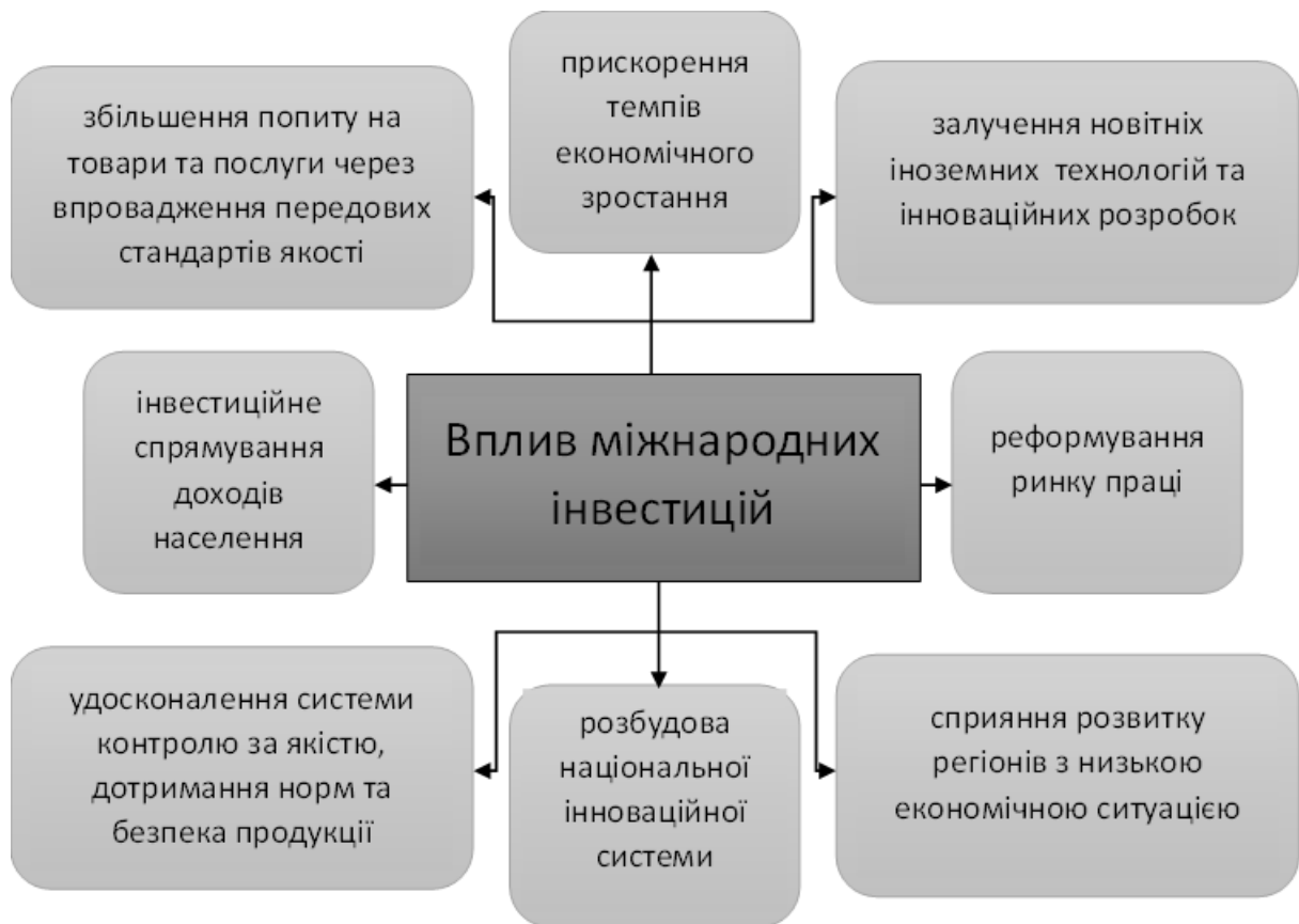
Рисунок 3. – Вплив іноземних інвестицій.