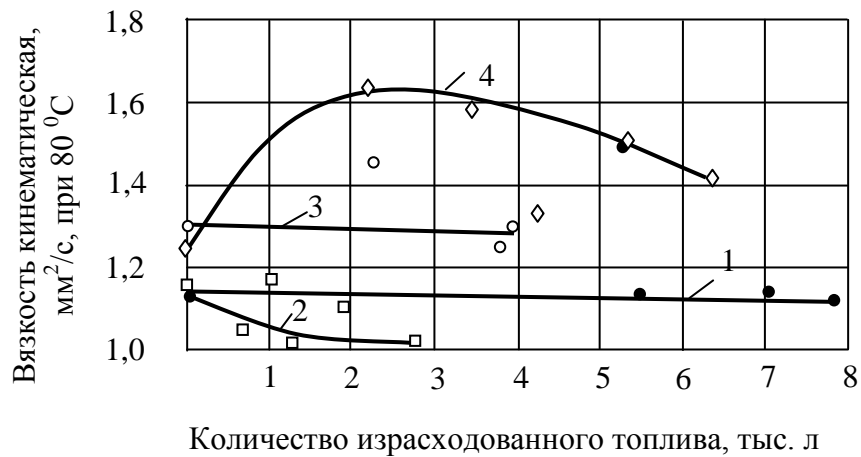
Рисунок 4 – Изменение кинематической вязкости антифриза от количества израсходованного топлива: ● 1 – ВАЗ-2107 (ТОСОЛ TC FELIX-40); □ 2 – Hyundai Accent (антифриз Shell G11); ○ 3 – ВАЗ-2115 (антифриз FELIX CARBOX G12); ◇ 4 – ВАЗ-21104 (антифриз SWAG).

Для установления срока службы антифриза по его фактическому состоянию, индивидуально по конкретному автомобилю, необходимо осуществлять постоянное диагностирование, то есть контроль качества антифриза путем проведения физико-химического анализа его проб. Следует, однако, отметить, что такой контроль сопряжен со значительными трудностями, что обусловлено, в частности, необходимостью в эксплуатирующих организациях иметь специальные химические лаборатории, постоянный штат сотрудников, соответствующее оборудование, реактивы и т.п. Поэтому необходим, интегральный браковочный параметр антифриза, который характеризовал бы его состояние в целом и определение, которого не занимало бы много времени, таким показателем может быть электропроводность антифриза.