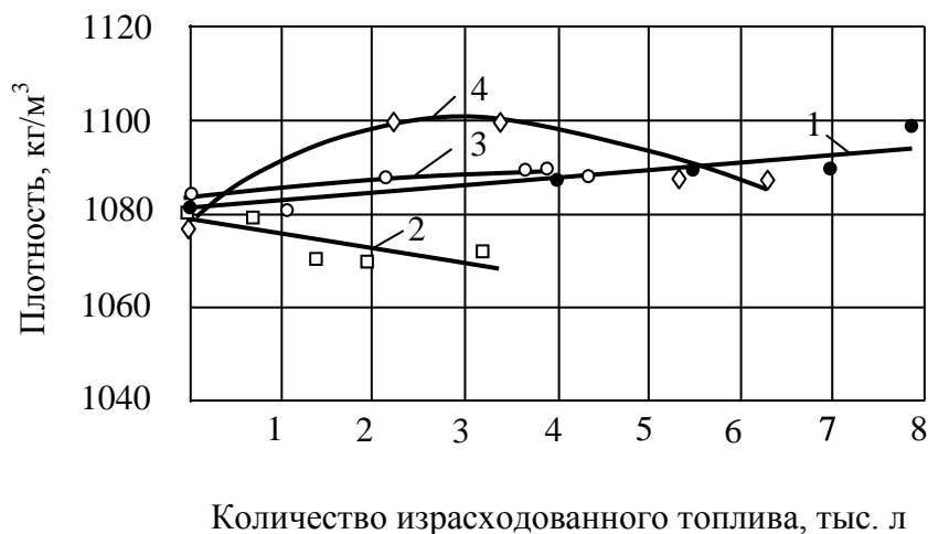
Рисунок 2 – Изменение плотности антифриза от количества израсходованного топлива: ● – ВАЗ-2107 (ТОСОЛ ТС FELIX-40); △ – Hyundai i30 (антифриз Shell SKY G11); × – ЗАЗ-1103 (ТОСОЛ А-40); ○ – ВАЗ-2115 (антифриз FELIX CARBOX G12); □ – Hyundai Accent (антифриз Shell G11); ◇ – ВАЗ-21104 (антифриз SWAG).

Увеличение или снижение плотности антифриза (рис.2) от начальных значений приводит к повышению температуры начала кристаллизации антифриза.