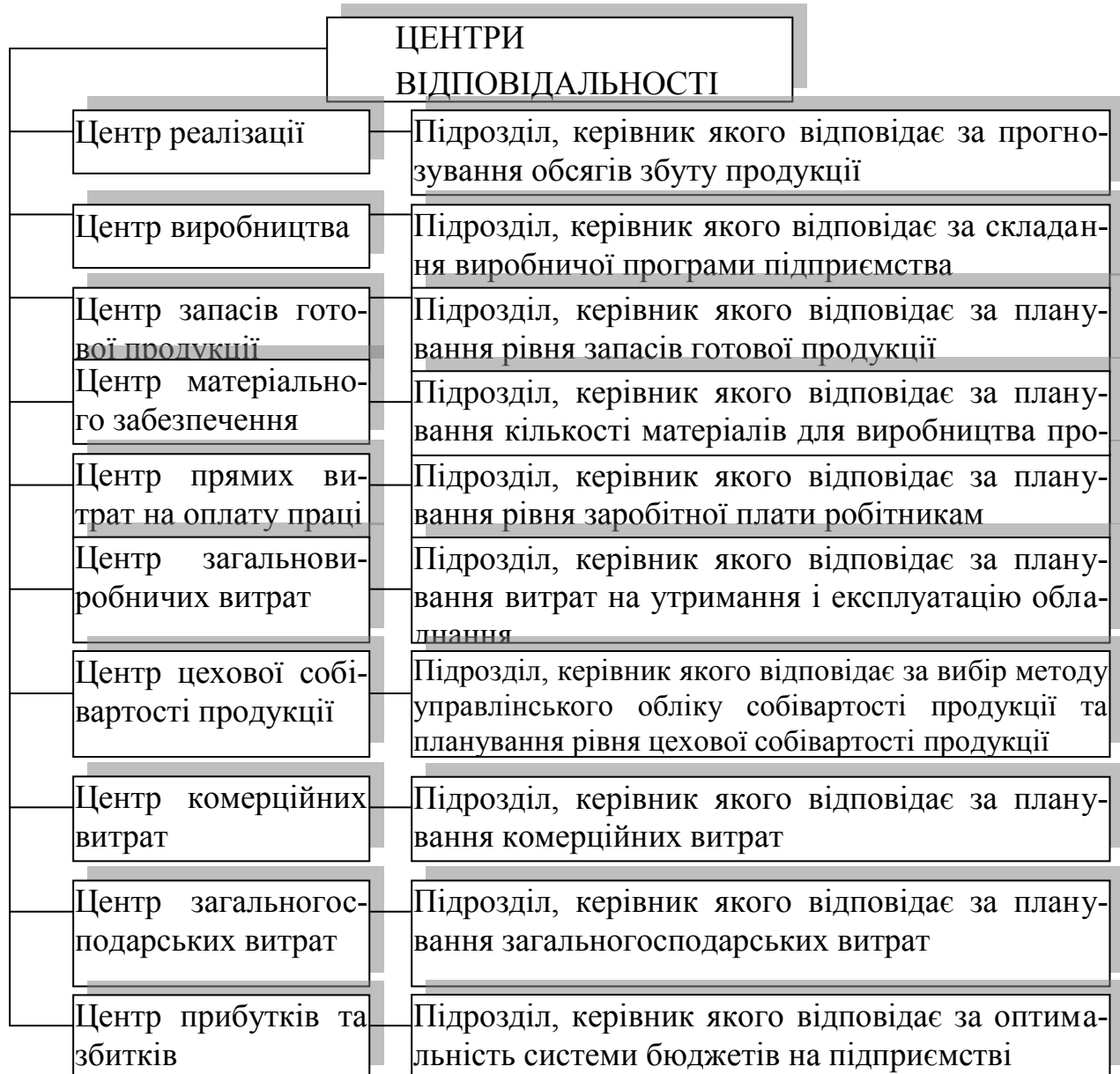
Рис. 3 – Запропонована класифікація центрів відповідальності підприємства

З рис. 2 видно, що більшість центрів відповідальності дублюють функції один одного. З нашої точки зору, перспективною є розробка альтернативної класифікації центрів відповідальності, яка повинна бути більш тісно пов'язана з системою бюджетів підприємства (див. рис. 3).