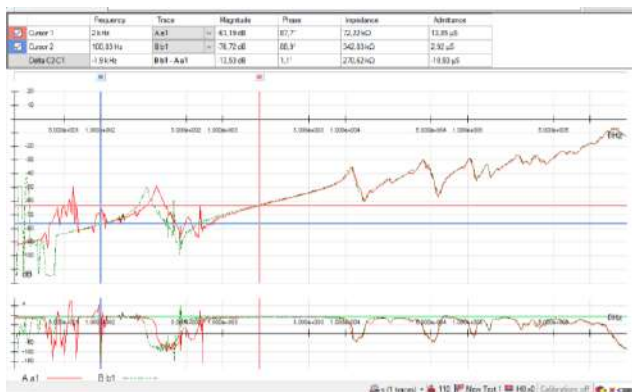
Рис. 2 – Графіки залежності діагностичних частотних параметрів трансформатора ТМ – 6300/110 від частоти (отримані шляхом використання приладу FRAnalyzer)

Тому такий трансформатор потребує подальших поглиблених обстежень з метою обґрунтування умов подальшої експлуатації та обслуговування.