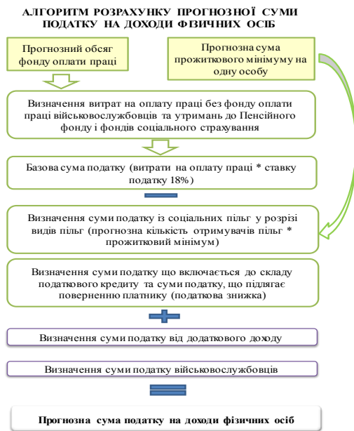
Рис. 1 – Розрахунок прогнозного показника податку

де ПН – прогнозована величина податкових надходжень за видом податку; a і b – коефіцієнти регресії; k – прогнозований період; ВРП k – прогнозоване значення валового регіонального продукту у k-му прогнозованому періоді.