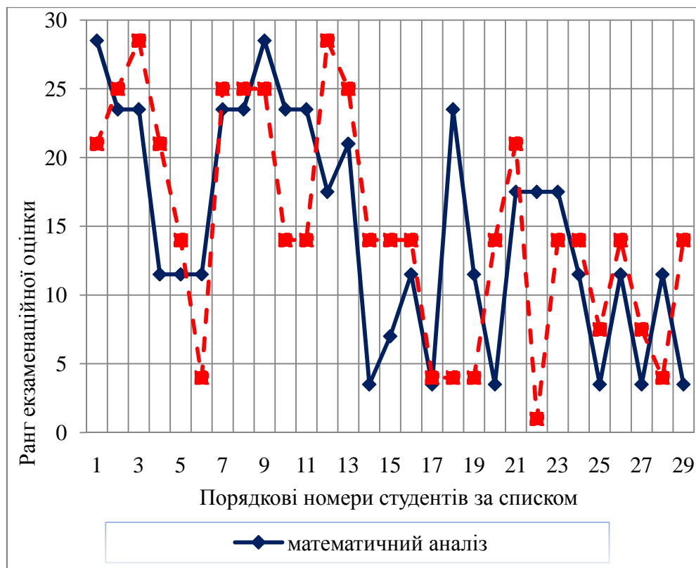
Рис. 1. Многокутники розподілів рангів за ознаками X та Y

У ході педагогічного експерименту було здійснено аналіз стану результатів навчання бакалаврів за напрямом «Програмна інженерія» з математичної та професійної підготовки (рис. 1). Розподіл частот оцінок [3] по цих дисциплінах наведений в порівняльній діаграмі (рис. 2).