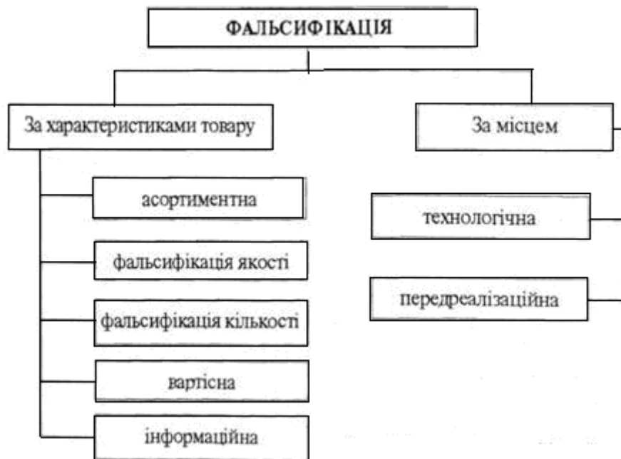
Рис. 1 – Види фальсифікації продуктів харчування

кації підробці піддається, як правило, одна чи більше характеристик товару. Це дозволяє провести класифікацію видів фальсифікації (рис. 1).