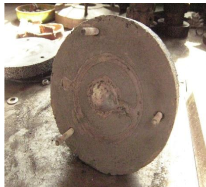
Рис. 2. Ізолюючий матеріал з титанової губки та Al_2O_3

в порівнянні з простою сумішшю титанова губка-наповнювач.