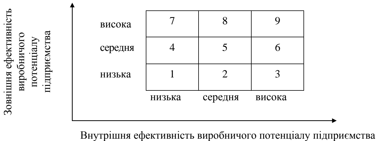
Рис. 1 Узагальнена матриця стратегій управління ефективністю виробничого потенціалу підприємства

зовнішньої ефективності в якості основних критеріїв матриці стратегій управління виробничим потенціалом підприємств за відповідними інтегральними показниками, кількісні значення яких можуть бути обґрунтовано співставленні завдяки методологічній єдності розрахунку. Запропонована матриця представлена на рис. 1.