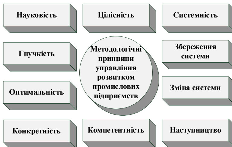
Рис. 3. Основні принципи управління розвитком промислових підприємств