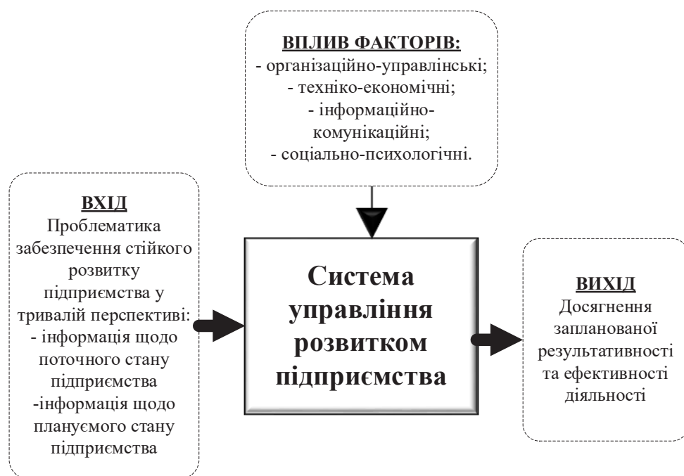
Рис. 1. Основні елементи системного підходу управління розвитком підприємства

– Конкретність. Ефективність управління сталим розвитком промислових підприємств обумовлюється відповідністю умовам і факторам соці-