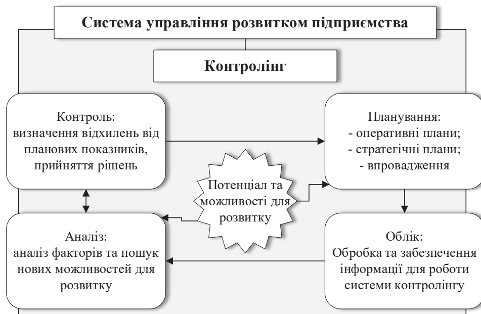
Рис. 5. Система управління розвитком промислового підприємства на засадах контролінгу