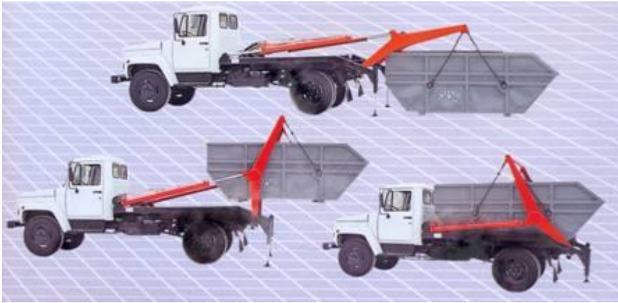
Рис. 1 – Багатофункціональний автомобіль – "мультиліфт", модель КО 425

В усіх моделях описаних вище комунальних машин комплекс технологічних операцій виконується за допомогою гідроприводу. При цьому надзвичайно важливою складовою останнього є маніпуляційні та силові гідроциліндри. Найбільш складними деталями останніх з позиції технологічності є гільзи, оскільки їх отвори належать до класу глибоких і повинні задовольняти наступним вимогам: точність за криволінійністю твірної – 0,1–0,15 мм/м, а по діаметру – Н7–Н9 при шорсткості опорної площі Ra 0,05–Ra 0,15. У базових технологічних процесах заготовками для гільз гідроциліндрів служать гарячекатані труби із доєвтектоїдних вуглецевих конструкційних сталей марок 35 або 45 чи відповідних закордонних аналогів.