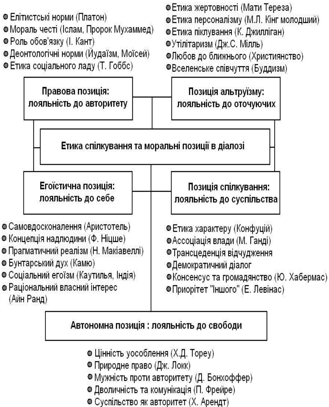
Рис. 2. Етика спілкування та моральні позиції у діалозі.

Часто, коли ми маємо справу з етикою у контексті різних систем цінностей, ми стикаємося зі змінами, які не є спорідненими з іншими сферами академічних досліджень. У сучасній західній філософії (Ю. Хабермас, Х. Арендт, Ж. Дерріда, Дж. Агамбен, У. Еко), наприклад, спілкування та діалог розглядаються як невід'ємна частина об'єктивної