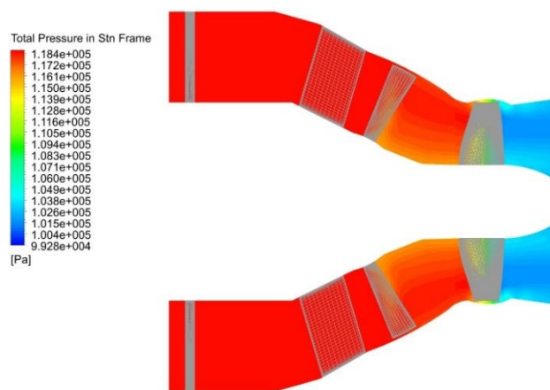
Рис. 3 – Розподіл повного тиску в проточній частині гідротурбіни

На основі отриманих даних було проведено розрахунок гідравлічних втрат в основних елементах проточної частини. Сумарні втрати склали 8,1%, причому найбільші втрати (3,8%) спостерігаються в робочому колесі, де відбувається основне перетворення енергії.