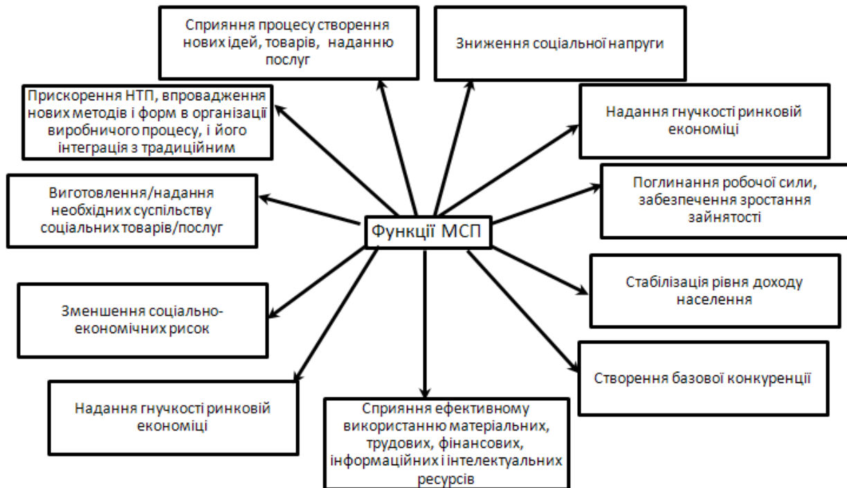
Рис. 2. – Функції МСП

Розглядаючи роль МСП в економіці України, необхідно з'ясувати, які функції вони в ній виконують (рис. 2), яке взагалі місце вони займають у національній економіці і якими відмінними рисами володіють.