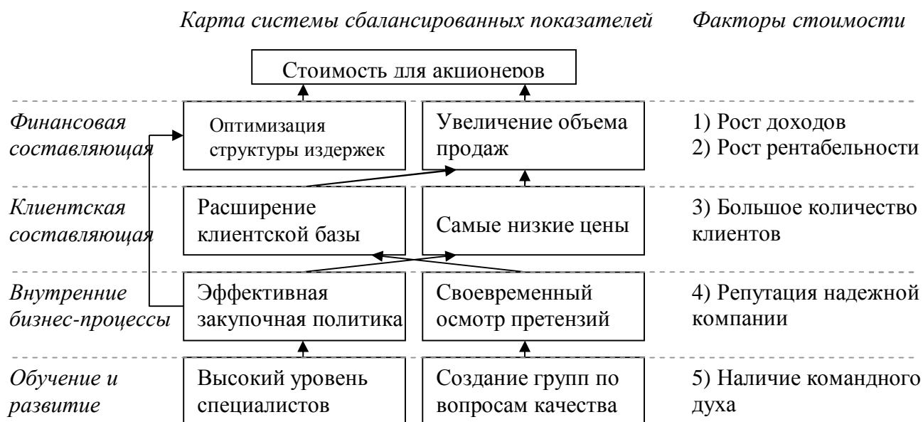
Рис.1 – Оценка деятельности на основе системы сбалансированных показателей

Факторы стоимости — это ключевые конкурентные преимущества компании, которые позволяют ей преуспеть на рынке относительно других компаний. Данные конкурентные преимущества могут быть существующими или потенциальными. Достижение этих конкурентных преимуществ, как правило, формулируется в стратегических целях компании. На рис.1 представлен пример построения системы оценки эффективности деятельности компании на основе выделения факторов стоимости компании.