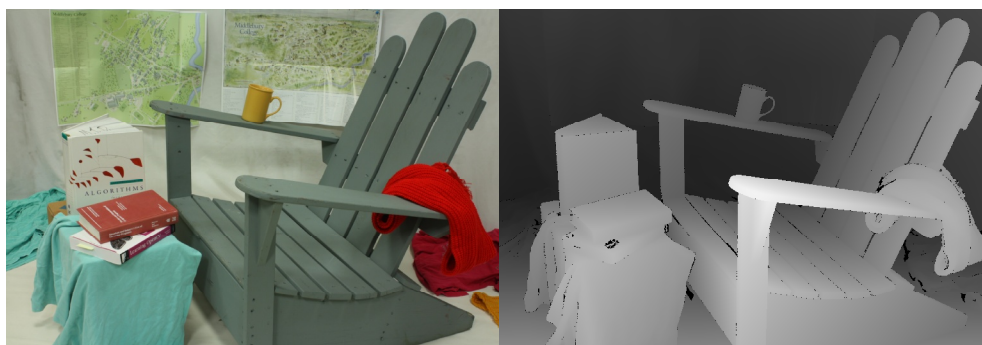
Рис. 1. Примеры изображения и соответствующей карты глубины