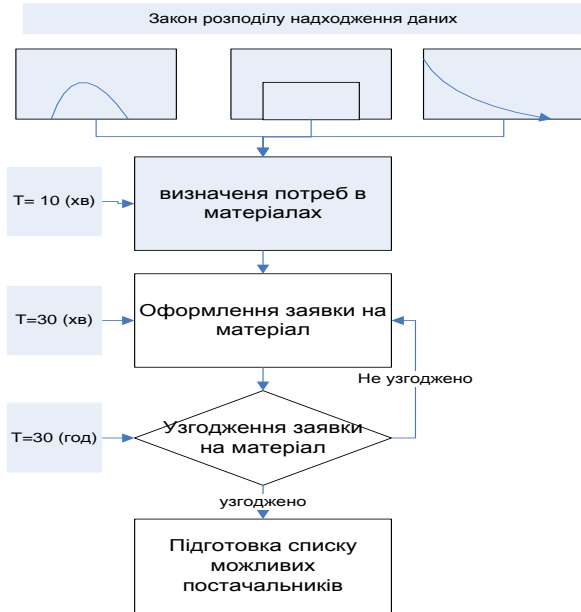
Рис. 2 - Ділянка БП де може виникнути «вузьке місце»

Тривалість виконання роботи «Визначення потреб в матеріалах» процесу «Підготовка і оформлення заявки на матеріал» залежить від того, який широкий асортимент продукції виробляє підприємство, та кількість складових кожної сировини для виробництва одиниці кожного виду продукції. Подаючи на вхід моделі процесу різні значення даних параметрів можна дізнатися як коливатиметься тривалість даної роботи в залежності від перерахованих показників.