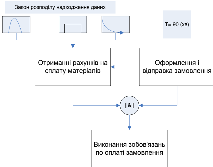
Рис. 3 - Ділянка БП де може виникнути «вужьке місце»

постачальники не перешлють рахунки на сплату матеріалів процес «Виконання зобов'язань по оплаті замовлення» не почнеться. В залежності від характеру надходження рахунків змінюється навантаження на ресурс, що виконує процес «Виконання зобов'язань по оплаті замовлення» під час виконання всього процесу.