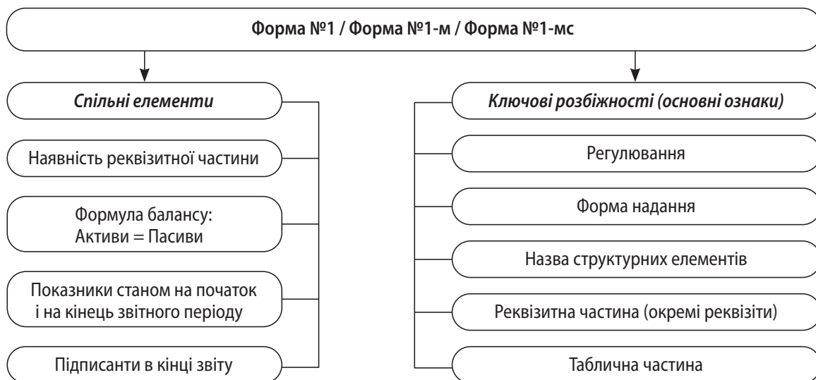
Рис. 2. Спільні елементи та розбіжності у формах № 1, 1-м і 1-мс

Першочерговим завданням в оцінці форм, які подають малі підприємства та середні суб'єкти господарювання, є порівняння їх за загальними характеристиками відносно наявності чи відсутності окремих елементів, структурних складових (рис. 2).