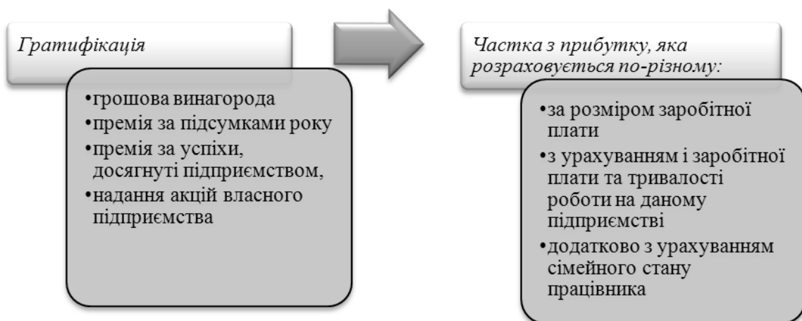
Рис. 2- Форми участі у прибутку [2]

Участь у прибутку має різні форми, рис. 2.