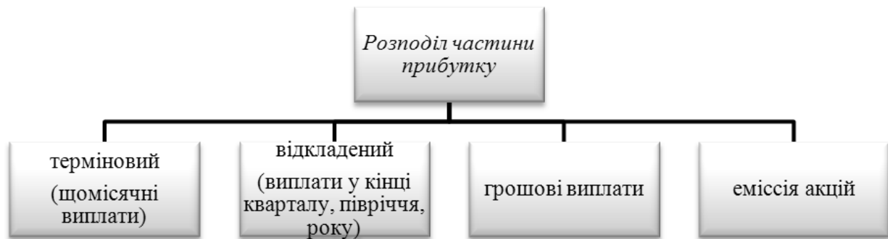
Рис. 1- Види розподілу частини прибутку між працівниками

«Участь у прибутку» за визначенням Міжнародного конгресу підприємців - це відповідна виплата, яка підготовлена і розроблена за спеціально складеною роботодавцем схемою, і яку не можна змінювати, не зачіпаючи матеріальних інтересів співробітників, рис.1 [1].