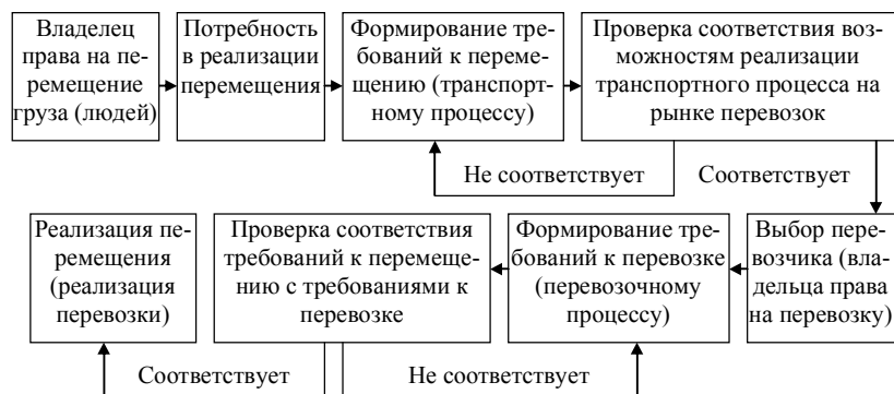
Рис. 1 Схема стыковки транспортных и перевозочных процессов (предлагается)

перемещения груза (людей) в условиях, когда перемещение осуществляется сторонней организацией (на условиях аутсорсинга) – рис. 1.