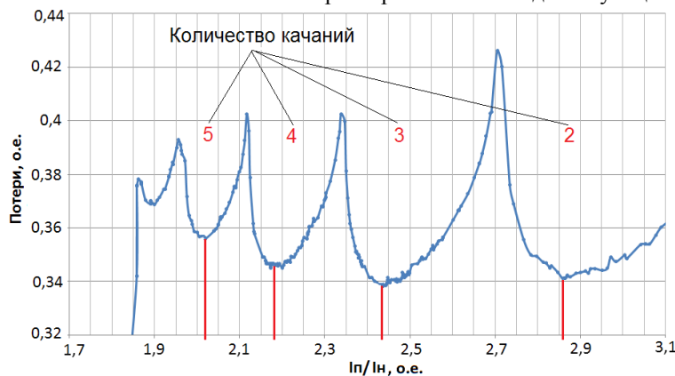
Рисунок 3 – Зависимость тепловых потерь от пускового тока

В ходе исследования с целью поиска значений пусковых токов, минимизирующих тепловые потери, проведено многократное моделирование процесса запуска для асинхронного двигателя СИМО Y4001-6 мощностью 315 кВт и номинальным током 580 А. Значение статического момента дебаланса соответствует запуску без раскачивания при токе 2100 А. В результате получена зависимость, представленная на рисунке 3. Тепловые потери оценивались по отношению к потерям при токе 1800А действующем в течение 20 с.