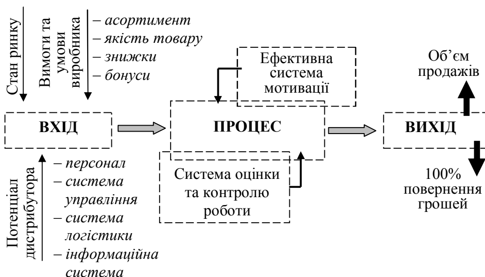
Рисунок 2. Визначення основних задач діяльності дистрибуторських компаній

Основні задачі, що підлягають виконанню дистрибуторськими компаніями є наступними (рис. 2):