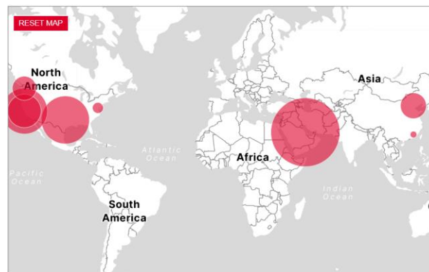
Рис. 2 - Географічний розподіл та доходи провідних транснаціональних компаній з діапазоном доходів від 50 до 150 млрд. дол. США

В даному випадку більшість корпорацій зосереджені в промислово розвинених країнах. Це свідчить про значний вплив, який вони мають на глобальну економіку, зокрема, у контексті інвестиційного потенціалу та розподілу капіталу. Такі корпорації визначають економічні тренди та стратегії на міжнародному рівні, що має велике значення для економічного розвитку менш розвинених країн. В даному випадку переважна більшість таких компаній зосереджена в Північній Америці та Азії, з меншою кількістю в Європі. Це свідчить про значний вплив великих транснаціональних компаній, які домінують у промислово розвинених країнах і визначають ключові економічні тренди та стратегії.