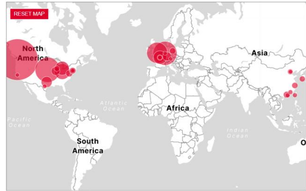
Рис. 4 - Географічний розподіл та доходи провідних компаній з діапазоном доходів 1 млрд. дол. США

В даному випадку спостерігається концентрація бізнес структур в розвинених країнах, але вони представляють собою ширший спектр організаційних форм, включаючи не тільки великі транснаціональні корпорації, але інші підприємства, які активно залучені у міжнародну діяльність. Ці структури можуть включати стратегічні альянси, спільні підприємства, міжнародні консорціуми та інші форми співпраці.