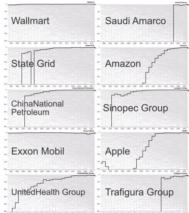
Рис. 1 - Зміни у технологічному та економічному середовищі топ-10 компаній світу

Міжнародні бізнес-структури також забезпечують унікальну можливість для глобального співробітництва та розподілу знань, сприяючи інтеграції різних ринків і культур. Це робить їх центральними фігурами в дослідженнях міжнародного бізнесу та економіки, особливо у контексті стійкого розвитку та корпоративної відповідальності. Вивчення їх структур та стратегій відкриває нові перспективи для розуміння глобальних економічних процесів та формування міжнародних економічних політик. [4]