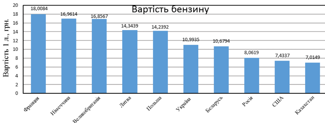
Рисунок 1 – Вартість 1 літру неетильованого бензину в різних країнах

На рис. 1 представлена інформація про ціни за літр неетильованого бензину в різних країнах за березень 2013 року, що перераховані у грн./л [5].